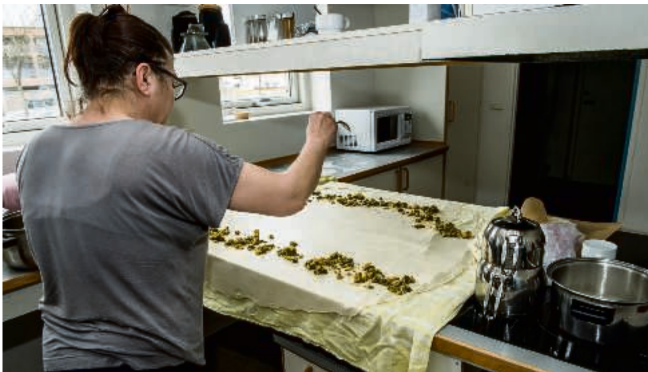
En af kvinderne fremtryller med stor ekspertise og ildhu de lækreste små brød af filodej.