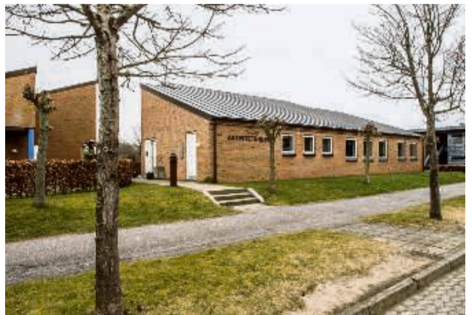
Aktivitetshuset i Houkær, hvor kvinderne mødes til avislæsning.