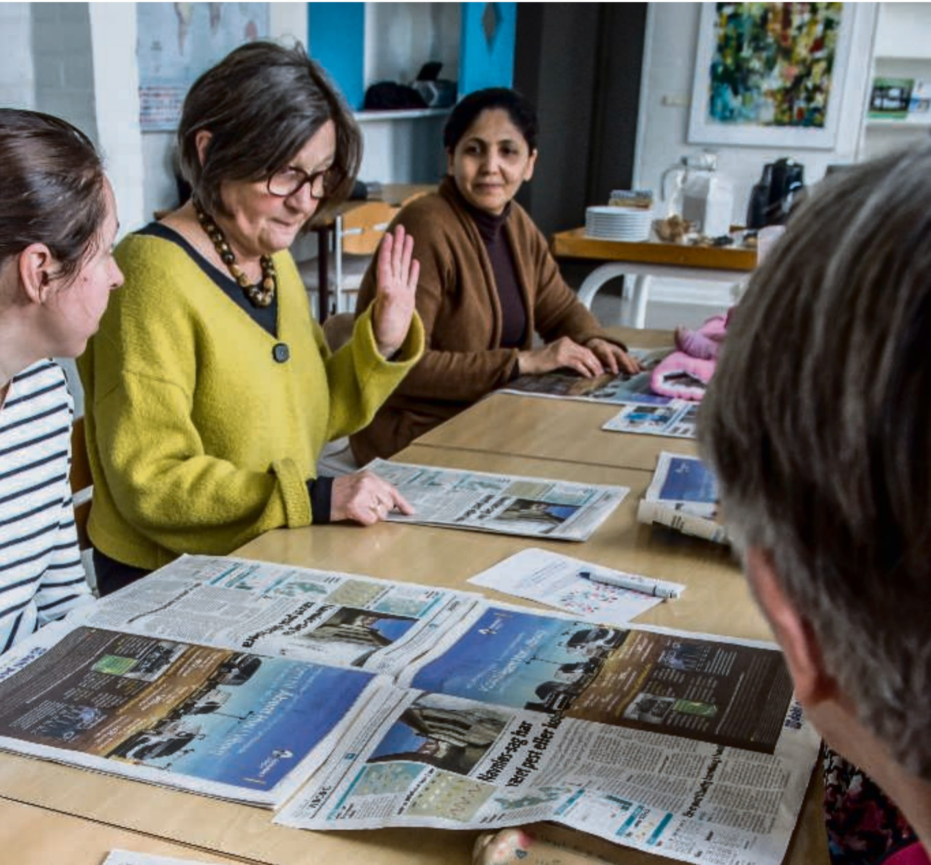
Indvandrerkvinderne læser i dagens avis med stor interesse.

tikler og indlæg, som var af politisk karakter: »Jamen, er valget ikke afgjort på forhånd?«.